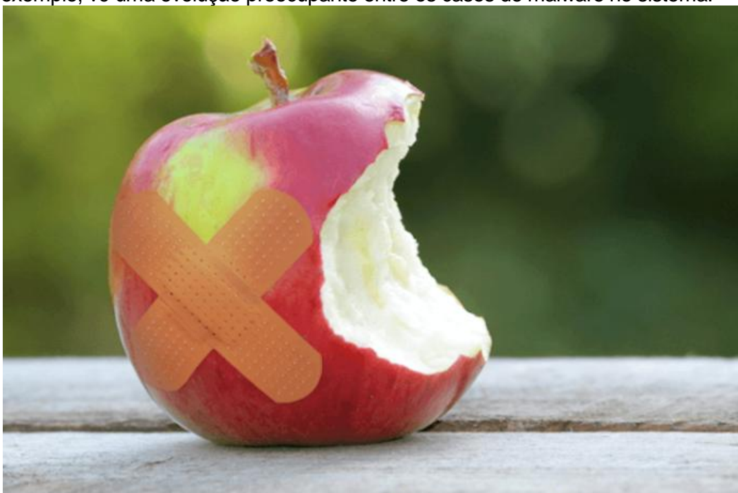
Vírus para Mac OS X chegam a 1,8 mil e ameaças ficam mais sofisticadas

Há algum tempo, havia uma certeza de que computadores equipados com Mac OS X não pegavam vírus. Atualmente, também não se fala muito nesta possibilidade, mas já há especialistas em segurança digital afirmando que os riscos no Mac OS X vêm crescendo. Eugene Kaspersky, que lidera a Kaspersky Lab, por exemplo, vê uma evolução preocupante entre os casos de malware no sistema.